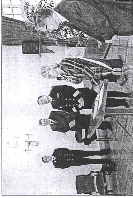
Les membres du partenariat sont invités à le faire vivre dans l'avenir